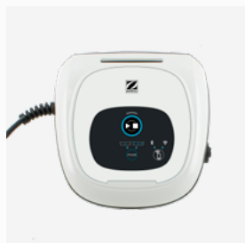
Caixa de comando